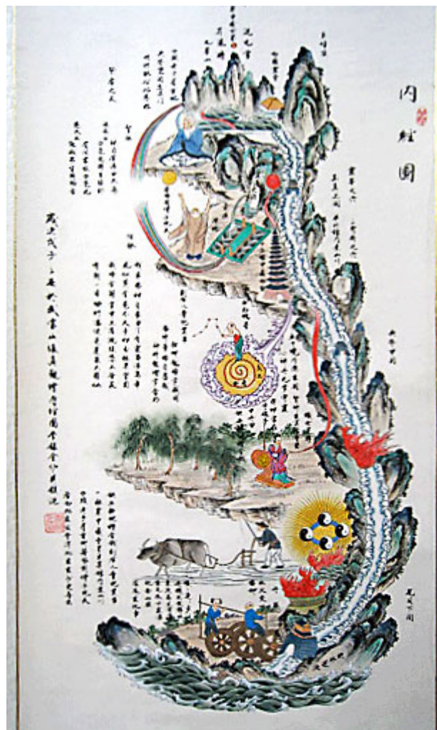
Diagramme de l'alchimie taoïste interne nommée nei tan, où l'alchimiste utilise son propre corps comme atelier.

Plus loin, quelques explications concernant l'alchimie interne taoïste permettront de lever un coin du voile sur les accords dans le taijiquan.